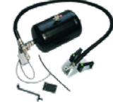
Tubeless inflation system Sistema di gonfiaggio TI