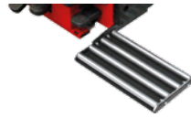
Roller board Kit rulliera